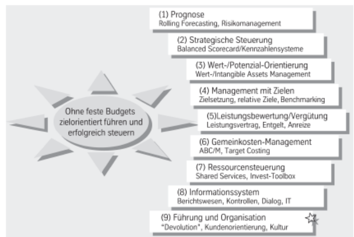
Abb. 34: Die Neun Gestaltungsfelder des Beyond Budgeting – für neue Prinzipien, Tools, Prozesse

Im ersten Teil des Buches macht Pfläging auf die vielseitigen Fehlentwicklungen und Grenzen der starren Budgetierung eindrücklich aufmerksam und bietet im zweiten Teil eine ganz andere Führungs- und Managementkultur an, die die künftigen Werte der Menschen einbezieht und geschickt nutzt.